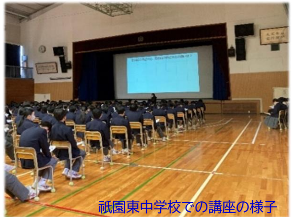
祇園東中学校での講座の様子

これらの団体以外でも、趣味の集まりや友人同士のグループなどで、講座を開催することもできますので、是非とも私たち地域包括支援センターにご相談ください！