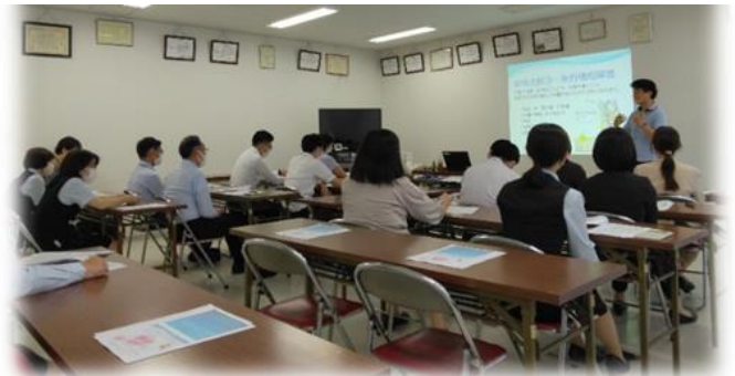
広島銀行安支店で開催しました