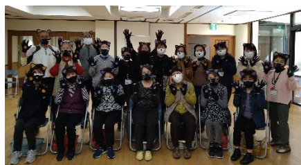
ハロウィン ←パーティー