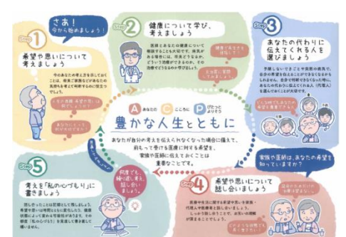
人生会議“私の心づもり”