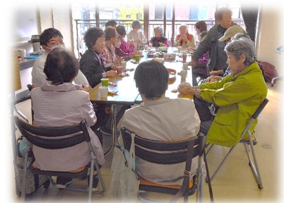
サロン終了後のカフェタイム