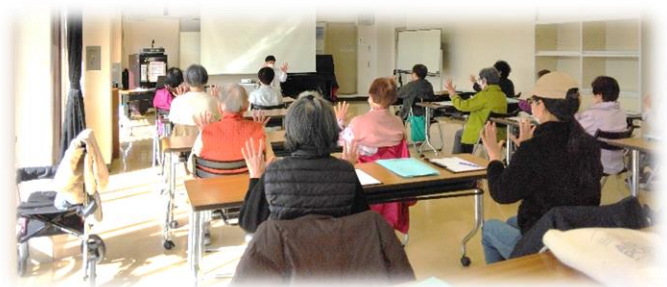
地域包括支援センター職員による講義、体操